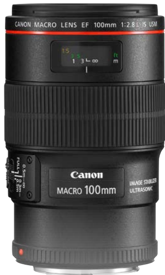
EF 100mm 1/2.8 L IS USM