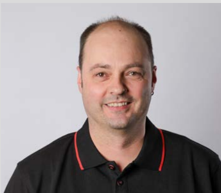
Michael Rogosch freiberuflicher Fotograf und Canon Academy-Trainer