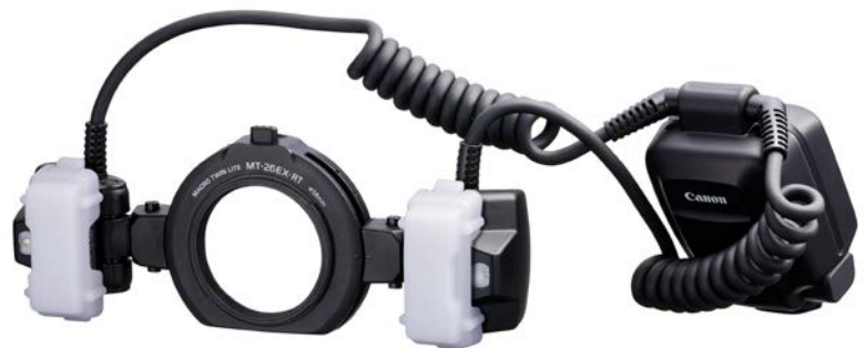
Macro Twin Lite MT-26EX-RT