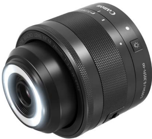
EF-M 28mm F3.5 Macro IS STM für spiegellose EOS M Kameras

Eine weitere neue und spannende Möglichkeit für die Objektbeleuchtung im Nahbereich bei Foto- und Videoaufnahmen bieten die Canon Makro-Objektive mit integrierter Makroleuchte. Die jeweils vorne im Objektivtubus integrierte ringförmige Leuchte kann wahlweise rechts oder links oder in Ringform zur Ausleuchtung des Motivs aktiviert werden. Per Tastendruck kann die Helligkeit der LED-Leuchten dabei direkt am Objektiv eingestellt werden.