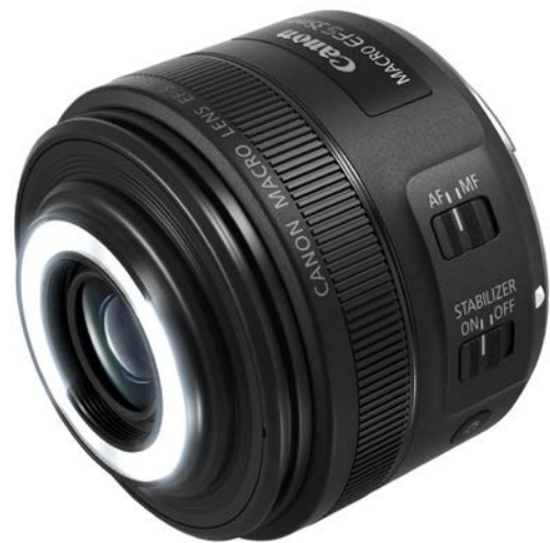
EF-S 35mm F2.8 Macro IS STM für EOS DSLR mit APS-C Sensor