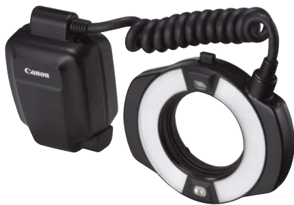
Macro RingLite MR-14EX II

Der Abstand zwischen Objekt und Objektiv lässt sich vergrößern, wenn man Makroobjektive mit einer längeren Brennweite benutzt wie z. B. das Canon EF 100mm f/2.8L Macro IS USM.