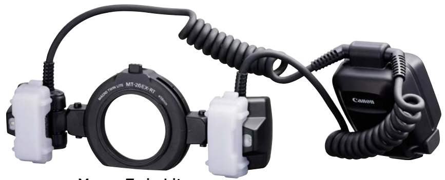
Macro Twin Lite MT-26EX-RT